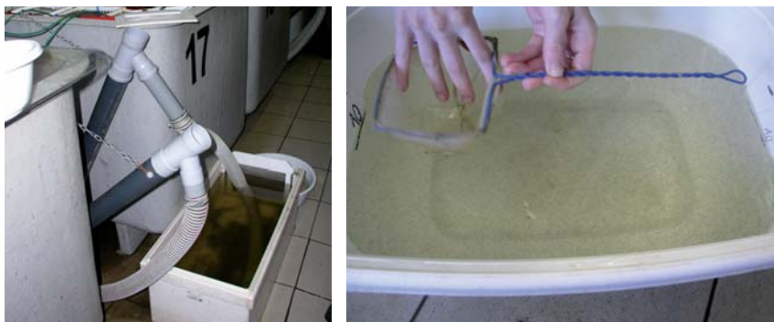
Obr. 16 a 17. Odsávání vylihnutých embryí z nádrže do kolíčky (vlevo) a přenesení embryí do vaničky k počítání jejich produkce (vpravo).

Inkubace jiker v jednotlivých košičkách byla postupně ukončena líhnutím embryí. Na konci masové inkubace byly jednotlivé jikrné provazce rozrušovány třepáním s košíčky i s jikrnými provazci, čímž došlo k uvolňování embryí z jikrných obalů. Poté byla embrya ze žlabů odsávána do kolíbek s jemnou síťovinou (průměr ok 300 \mu\text{m} ) (obr. 16) a odtud přenesena do vaniček s čistou vodou z líhně (obr. 17). Množství vylihnutých embryí bylo poté počítáno objemovou metodou, kdy embrya byla zhuštěna ve vodním prostředí na deset litrů. V tomto omezeném objemu vody byla embrya rozmíchána a poté bylo odebráno pět dílčích vzorků embryí, každý o objemu 10 ml. V jednotlivých vzorcích byla embrya spočítána. Z pěti vzorků bylo vypočítané průměrné množství embryí na 10 ml. Zjištěný průměrný počet embryí byl vynásoben 1 000, čímž byl zjištěn počet embryí v objemu 10 l. Po zjištění celkového množství získaných embryí byla vypočítána celková líhnavost embryí v rámci masové umělé inkubace jiker (celkový počet všech získaných embryí se vydělil počtem všech nasazených oplozených jiker a poté se zjištěné číslo vynásobilo 100).