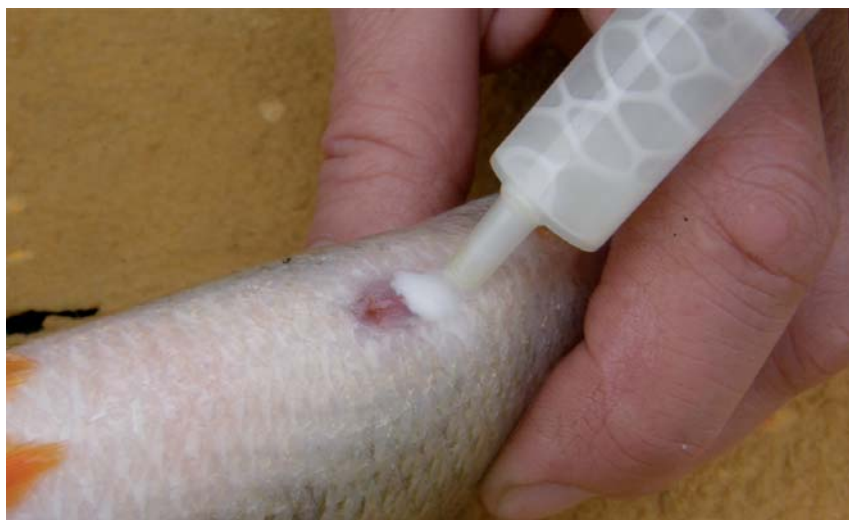
Obr. 9. Odběr spermatu u generačního mlíčáka.

Sperma od předem vybraných 60 generačních mlíčáků bylo odebíráno do injekčních stříkaček o objemu 5–10 ml. Při odběru spermatu byla masírována břišní partie těla mlíčáků, která je ukončena genitální papilou (obr. 9). Takto odebrané sperma bez kontaminace vodou, močí či krve bylo krátkodobě uchováno v lednici při teplotě 4–6 °C. Po získání spermatu od více mlíčáků (minimálně od tří) bylo toto sperma použito pro umělé osemenění dříve vytřených a získaných jiker od generačních jikernaček.