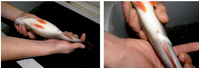
Obr. 4 a 5. Vhodná jikernačka a mlíčák uvolňující sperma – generační ryby vybrané pro výtěr.

mů a poškození povrchu těla. U jikernaček byla při výběru hodnocena zaplněnost břišních partií, která charakterizuje jejich dobrou připravenost na výtěr (obr. 4). U mlíčáků byli vybíráni jen jedinci, kteří po masáži břišních partií samovolně uvolňovali smetanově bílé sperma bez příměsí krve (obr. 5).