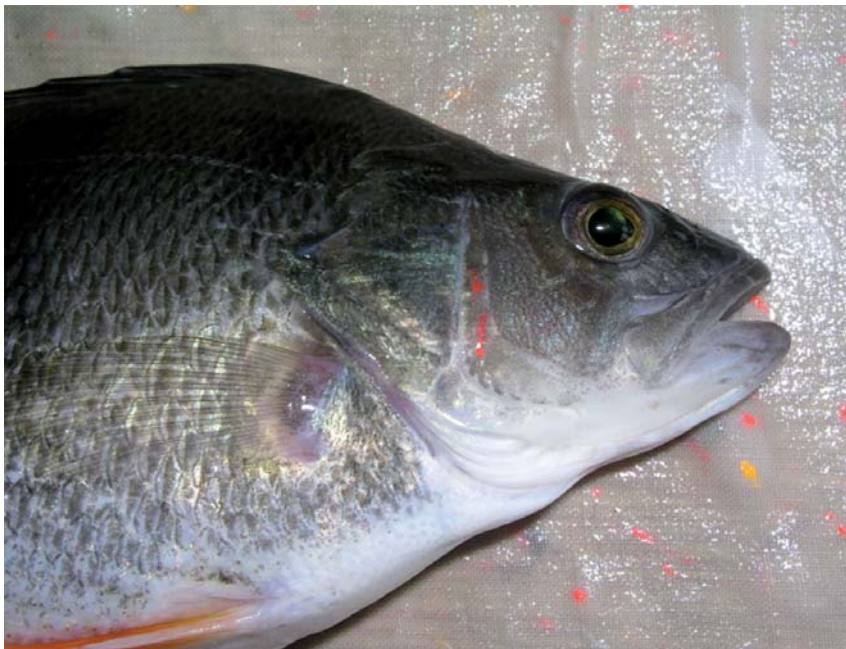
Obr. 7. Značení generačních ryb podkožními elastomery.

Po značení ryb byl intramuskulárně injikován do hřbetní svaloviny po levé straně těla ryb hormonální přípravek Supergestran, který obsahuje účinnou látku Lecirelin -sGnRH \alpha (D- Tle 6 , Pro 9 , Net) v koncentraci 25 \mu\text{g GnRH}\alpha\cdot\text{ml}^{-1} přípravku (obr. 8). Pro hormonální injikaci generačních jikernaček byla zvolena jednotná dávka 50 \mu\text{g GnRH}\alpha\cdot\text{kg}^{-1} jikernačky. Při takovéto dávce byl přípravek Supergestran generačním jikernačkám aplikován v dávce 2 ml Supergestranu. \text{kg}^{-1} jikernačky. Generační mlíčáci nebyli hormonálně stimulováni, protože všichni vybraní mlíčáci uvolňovali sperma spontánně.