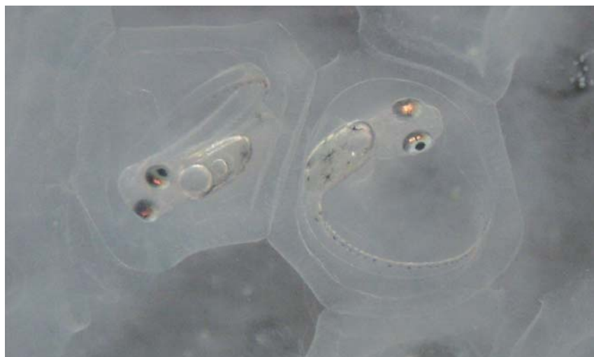
Obr. 15. Embrya okouna říčního v jikře těsně před vylhnutím.