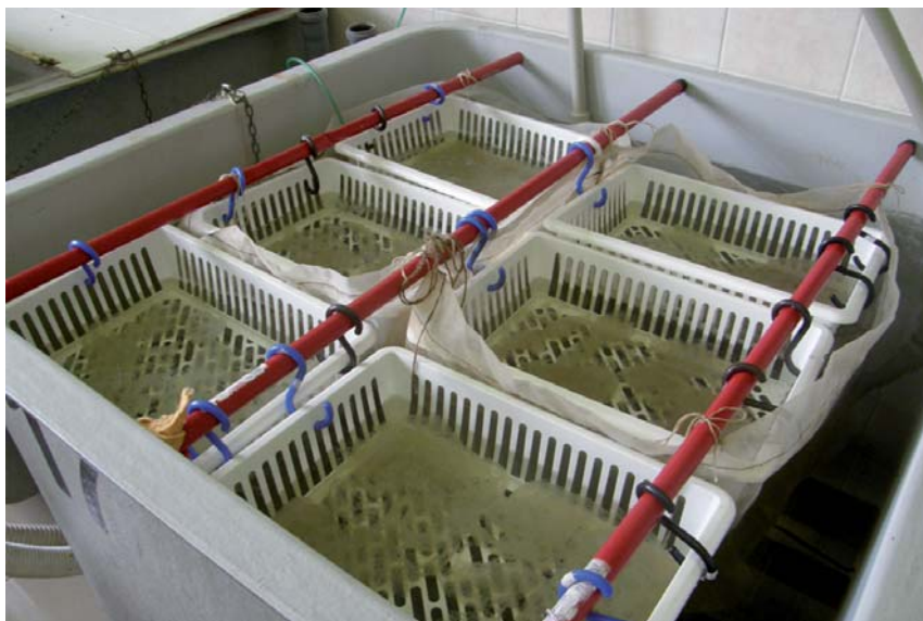
Obr. 14. Masová inkubace jikrných provazců v košíčcích.

Po výtěru byly provazce jednotlivých ryb inkubovány ve speciálních košíčcích (obr. 14) nejprve jednotlivě. Po odběru vzorků na stanovení oplozenosti jiker a líhivosti embryí byly inkubovány vždy společně 3 jikrné provazce na jeden košíček, který byl umístěn v odchovných žlabech RAS. Průměrná teplota vody při masové inkubaci byla 15,8 \pm 0,4 °C, pH = 7,4 \pm 0,1 a obsah rozpuštěného kyslíku O_2 = 8,0 \pm 0,2 mg.l -1 . Jednotlivé jikrné provazce byly vkládány do košíčků podle termínu jejich získání, což následně usnadnilo obsluhu práci při čištění vylíhnutých embryí. V průběhu inkubace jiker byla v intervalu 12 h kontrolována teplota vody, obsah rozpuštěného kyslíku a pH. Ve stejném intervalu byl hodnocen embryonální vývoj zárodků, což bylo důležitou podmínkou pro úspěšnou inkubaci jiker. Provazce, u kterých se jikry nevyvíjely normálně, popřípadě začaly odumírat (obsah jiker začal bělat), byly z jednotlivých košíčků odstraňovány. Hrozilo nebezpečí, že odumřelé jikrné provazce výrazným způsobem zhorší kvalitu vody při inkubaci zdravých provazců. Na konci masové inkubace jiker byla stanovena délka inkubace ve dnech, hodinách a denních stupních a líhivost embryí (počet získaných embryí byl vydělen počtem nasazených jiker a následně vynásoben stem).