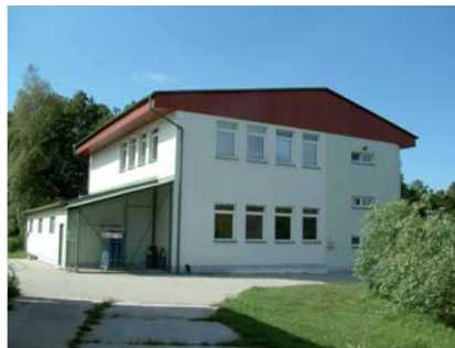
Obr. 2 a 3. Produkční líheň Rybářství Nové Hradky s.r.o. (vlevo) a experimentální rybochovné zařízení FROV JU ve Vodňanech (vpravo).