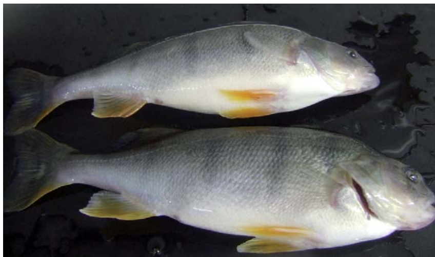
Obr. 1. Tržní okoun o hmotnosti 100–150 g.

Posledním způsobem produkce tržního okouna říčního je průmyslový odlov tohoto druhu z volných vod, např. velkých jezer nebo řek především v oblasti Skandinávie a zemí bývalého Sovětského svazu (Watson, 2008).