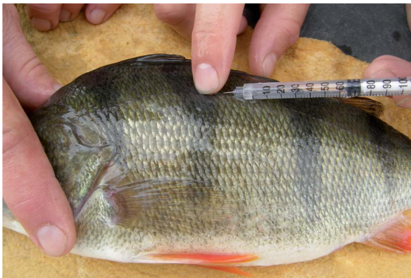
Obr. 8. Intramuskulární hormonální injekce generační jikernačky.