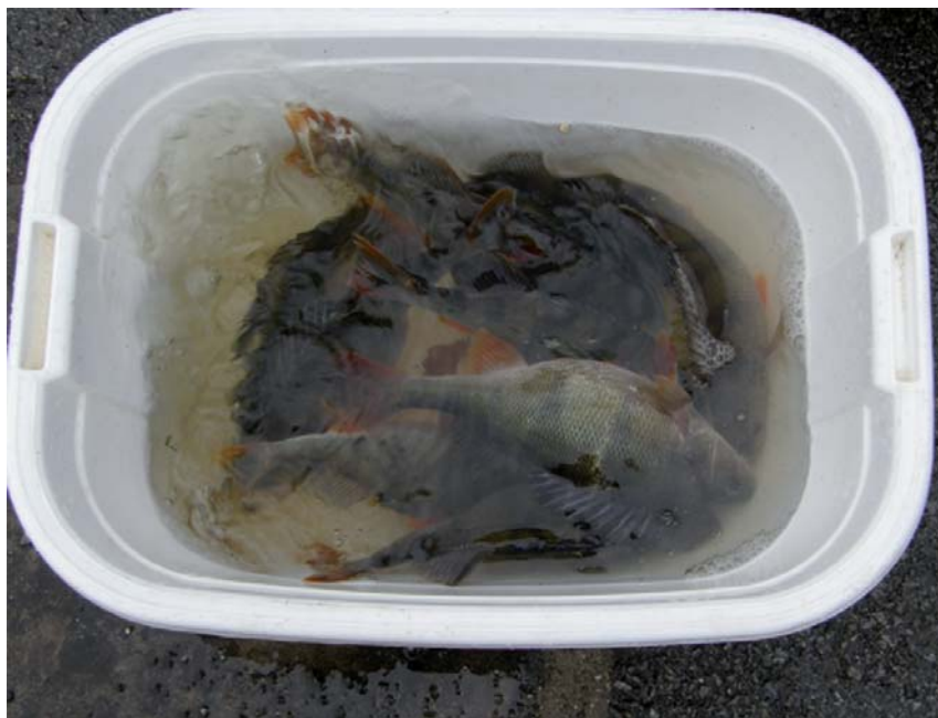
Obr. 6. Generační jikernačky při tvorbě jednotlivých skupin u umělého výtěru.

Po vytvoření jednotlivých skupin u obou způsobů výtěru, byly ryby v daných nádržích aklimatizovány po dobu 2 dnů, kdy byla zvýšena teploty vody z původních 11,4 °C (teplota vody odpovídající venkovní teplotě vody) na požadovaných 15,0–15,5 °C. U všech ryb byla zjištěna celková délka (TL) a hmotnost (W). Při manipulaci s generačními rybami byly všechny ryby zklidněny pomocí anestetika: hřebíčkový olej v dávce 0,033 ml.l -1 s expozicí 3–4 minuty (Hamáčková a kol., 2001; Policar a kol., 2009). Po zklidnění byly všechny ryby označeny podkožními elastomery VIE (Visible Implant Elastomer tag, Northwest Marine Technology, Ltd., USA). Ryby využívané pro umělý výtěr byly značeny oranžovou barvou a ryby využívané pro poloumělý výtěr byly označeny červenou barvou elastomerů. Všechny ryby byly značeny podkožními elastomery vždy na hlavě. Všechny jikernačky u umělého či poloumělého výtěru a 16 náhodně vybraných mlíčáků u umělého výtěru, kteří byli následně využíváni na odběr spermatu pro stanovení jejich plodnosti, byli značeni pomocí podkožních elastomerů individuálně. Značení jikernaček a 16 mlíčáků v dané skupině probíhalo tak, že umístění elastomeru na hlavě dané ryby představovalo číslo dané ryby ve skupině. Tím bylo zaručeno individuální značení ryb v dané skupině pro identifikaci ryb při výtěru (obr. 7).