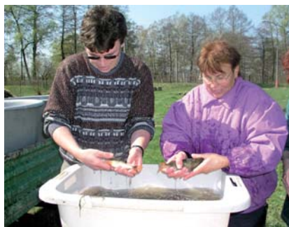
Obr. 18 a 19. Koupel generačních ryb v roztoku manganistanu draselného po výtěru (vlevo) a kontrola přežití generačních ryb 7 dní po výtěrovém období (vpravo).