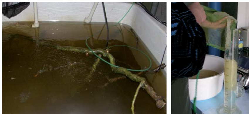
Obr. 12 a 13. Odchovná nádrž s vloženým výtěrovým substrátem pro generační okouny (vlevo) a zjišťování objemu jikrného provazce při poloumělém výtěru (vpravo).

Při sběru jikrných provazců jsme také odstraňovali již vytřené jikernačky a spolu s jejich evidenčním číslem byl zaznamenán přibližný čas jejich výtěru. Mlčící byli v nádržích ponecháni až do výtěru poslední jikernačky. U sesbíraných jikrných provazců jsme objemovou metodou podle Kouřila a kol. (1998), Kouřila a Hamáčkové (2000) a Kouřila a kol. (2001) zjišťovali pomocí odměrného válce s vodou celkový objem celého jednoho jikrného provazce (obr. 13). Dále byl zjištěn počet jiker v 1 ml daného jikrného provazce (viz hodnocení oplozenosti jiker) a následně celkový počet jiker v daném jikrném provazci . Pro stanovení počtu jiker v jednom mililitru jikrného provazce byl vždy odebrán malý vzorek jiker cca o objemu 1 ml. U odebraného vzorku byl objemovou metodou (podobně jako u stanovení objemu jednotlivých jikrných provazců) stanoven pomocí odměrného válce s vodou objem vzorku jiker. Dále byl u vzorku jiker spočítán počet všech jiker ve vzorku. Následně byl vypočítán počet jiker na 1 mililitr jikrného provazce tak, že počet jiker ve vzorku byl vydělen objemem vzorku v mililitrech.